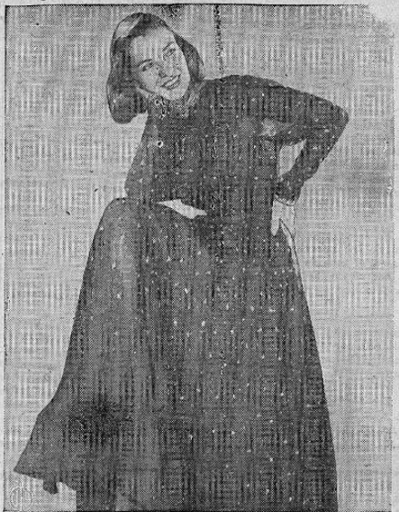
SOMBRERO CON ALAS — Dos pares de alas salen de la corona de este sombrero de zafiro azul que está luciendo en la colección de sombreros de Jay Thorpe de Nueva York.

JUEVES 14 TEATRO NACIONAL 2.45 pm.—Tentación 5.20, 7.40 y 9.50 pm.—Dillingen TEATRO PRINCIPAL 2.30 pm.—Noche en el Paraíso 5, 7.30 y 9.35 pm.—La Otra TEATRO ALICIA 5.30 y 8.15 pm.—Saigón CINE POPULAR 6.30 y 9 pm.—Leven Anclás